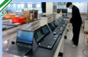
Chromebookを活用した課題研究

令和4年度は1・2年次生合わせて120グループ以上の課題研究を行いました。各グループのメンバーは、協力しながらChromebookを活用し、研究データの収集や発表資料の作成を行いました。そして、研究の成果を2月の課題研究校内発表会で互いに発表したり、他校や校外での発表会で発表しました。各グループが作成した研究資料は、今年度の課題研究活動で活用する予定です。