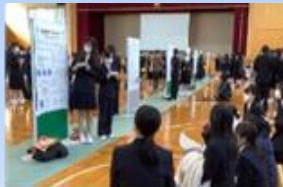
課題研究校内発表会