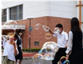
美作サイエンスフェア （美作大学）