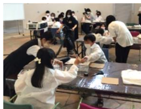
夏休み教室 （津山洋学資料館）