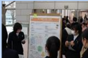
鳥取県SSH校での研究発表