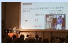
探究フォーラム2022での研究発表