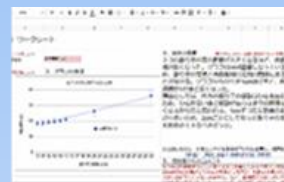
分析・考察方法の指導データ